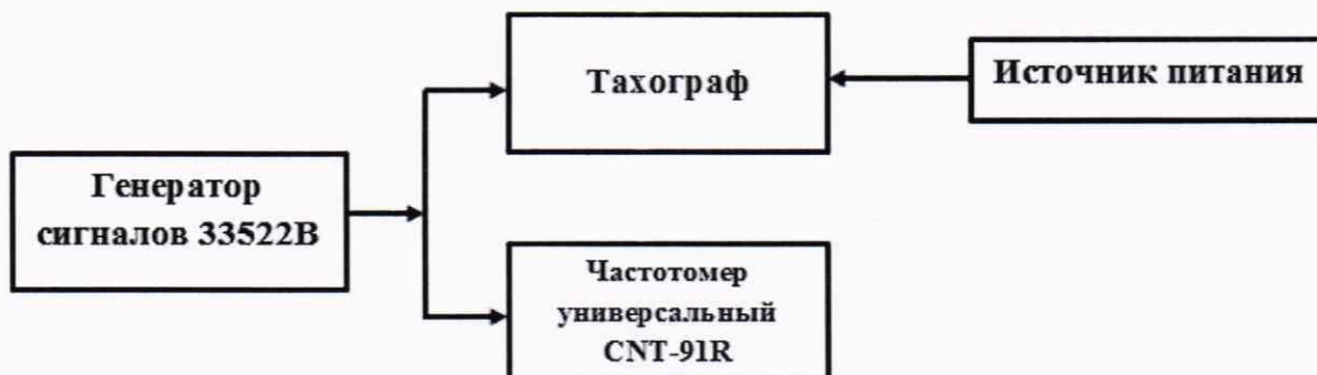
Рисунок 2 – Схема проведения измерений при определении абсолютной погрешности измерений интервала времени и абсолютной инструментальной погрешности измерений пройденного пути

8.3.1 Собрать схему в соответствии с рисунком 2.