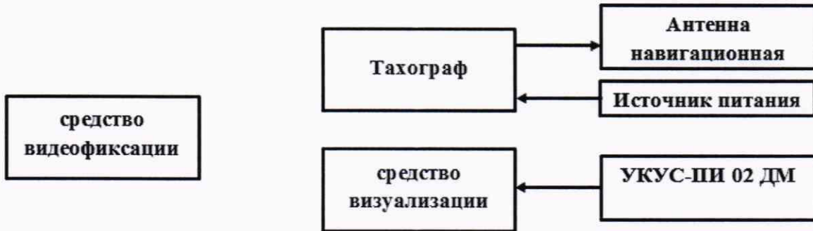
Рисунок 5 - Схема проведения измерений при определении абсолютной погрешности синхронизации шкалы времени внутреннего опорного генератора тахографа со шкалой времени блока СКЗИ

8.10.1 Собрать схему в соответствии с рисунком 5. Средство визуализации должно иметь разрешающую способность индикации оцифровки метки времени не менее 0,1 с.