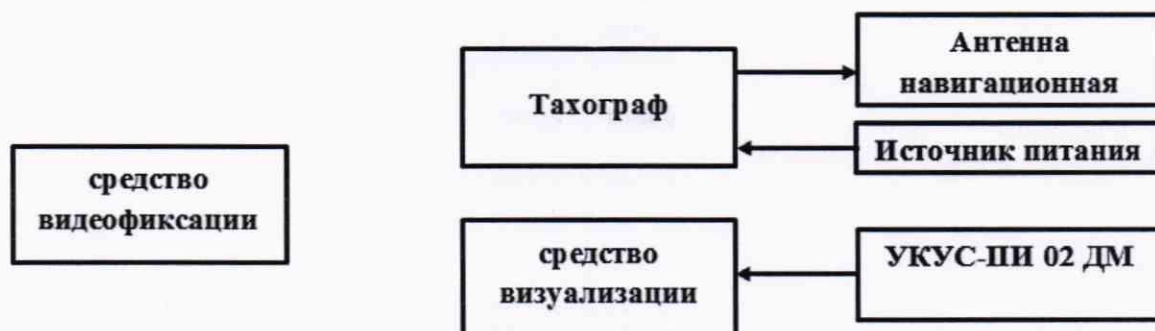
Рисунок 5 - Схема проведения измерений при определении абсолютной погрешности синхронизации шкалы времени внутреннего опорного генератора тахографа со шкалой времени блока СКЗИ

8.10.2 Обеспечить радиовидимость сигналов навигационных космических аппаратов ГЛОНАСС и GPS в верхней полусфере. В соответствии с эксплуатационной документацией на тахограф и УКУС-ПИ 02ДМ подготовить их к работе. Настроить УКУС-ПИ 02ДМ на выдачу шкалы времени, синхронизированной с национальной шкалой координированного времени UTC(SU).