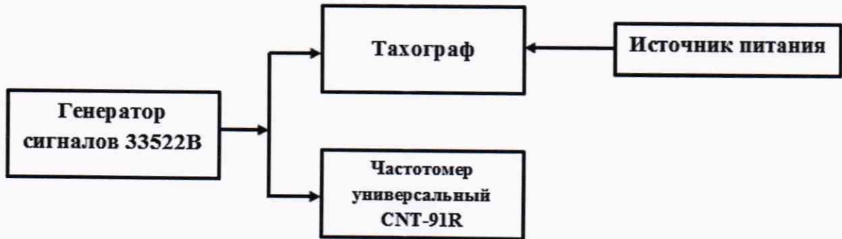
Рисунок 2 – Схема проведения измерений при определении абсолютной погрешности измерений интервала времени и абсолютной инструментальной погрешности измерений пройденного пути

8.3.1 Собрать схему в соответствии с рисунком 2.