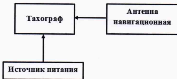
Рисунок 1 – Схема проведения измерений при опробовании

8.2.1 Собрать схему в соответствии с рисунком 1. Обеспечить радиовидимость сигналов ГЛОНАСС/GPS в верхней полусфере.